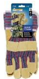
Ref. 17010 blister